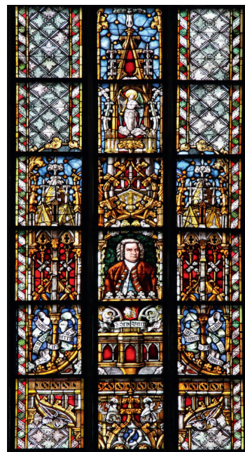
Portrait de J. S. Bach sur un vitrail de l'église St. Thomas de Leipzig

Le Petit livre d'orgue est un recueil à plusieurs dimensions, qui englobe technique de composition, pédagogie instrumentale, utilité liturgique, enseignement spirituel. Aucun aspect n'est écarté et ce musicien d'une trentaine d'années se tenait en maître de tous ces domaines de compétence ; c'est le même élan intérieur qui le poussait à la même période à écrire son premier livre du Clavier bien tempéré . Chaque choral est traité par un musicien-poète doublé d'un théologien 7 . Bach ne dépasse généralement pas la durée d'une strophe de choral et tient la plupart du temps à ce que la mélodie soit clairement énoncée, notamment au soprano. Albert Schweitzer explique : « La nouveauté du procédé consiste à faire entendre la mélodie du choral accompagnée et expliquée, pour ainsi dire, par un motif caractéristique qui dépeint le côté saillant du texte. D'où une série de descriptions, une luxuriante abondance de poésie musicale qui fait de ce petit livre du maître l'un des chefs-d'œuvre de son art, un chef-d'œuvre d'un charme tout à fait moderne. 8 »