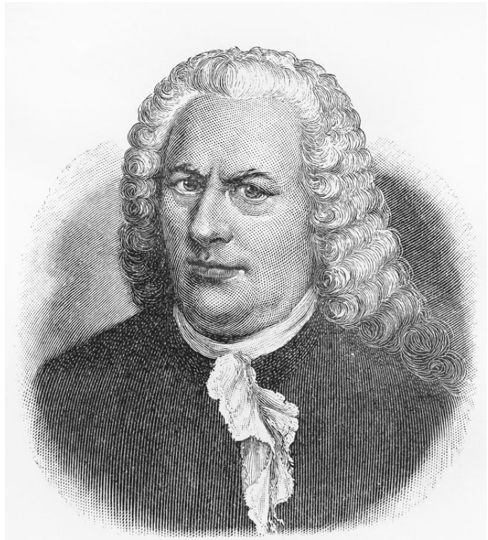
Portrait de J. S. Bach